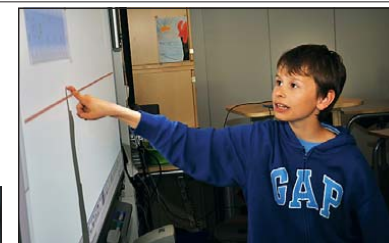
INTERAKTIV: Et smartboard er en interaktiv tavle. Det betyr blant annet at du kan trykke direkte med fingeren på den hvite tavlen.