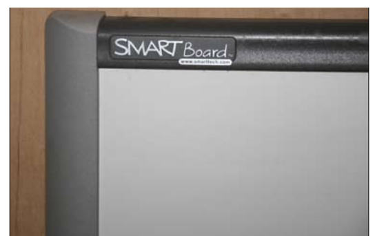
SMART Board uten permanent tusj