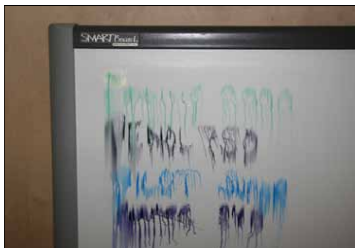
SMART Board med tusjrens