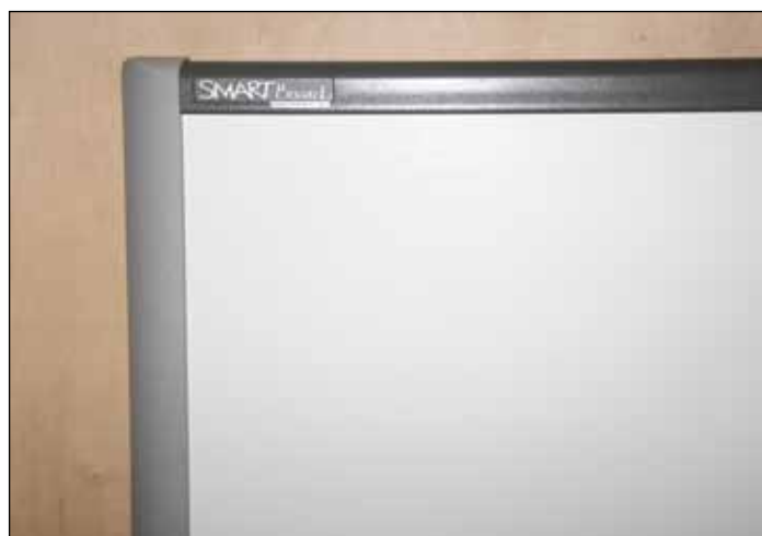
SMART Board etter tavlerens på kulepenn